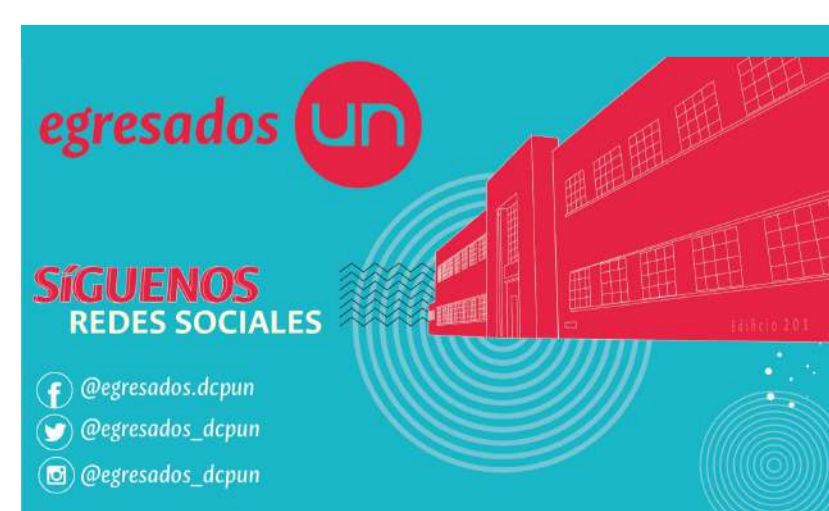
Invitamos a seguir las redes sociales de egresados de la Facultad de Derecho, Ciencias Políticas y Sociales