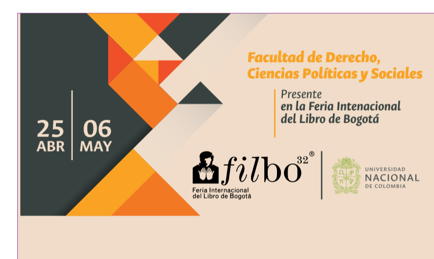
La Facultad de Derecho, Ciencias Políticas y Sociales estará presente en la 32ª edición de la Filbo.

La Feria Internacional de Libro de Bogotá tendrá lugar del 25 de Abril al 6 de mayo de 2019, donde la Facultad de Derecho, Ciencias Políticas y Sociales se encontrará presente con el lanzamiento de 7 libros.