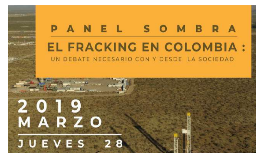
Panel Sombra "El Fracking en Colombia" Un debate necesario con y desde la sociedad.

El pasado 28 de marzo de 2019 se llevó a cabo El Panel Sombra "El Fracking en Colombia". Invitamos a ver el vídeo del evento que tuvo transmisión por Facebook Live.