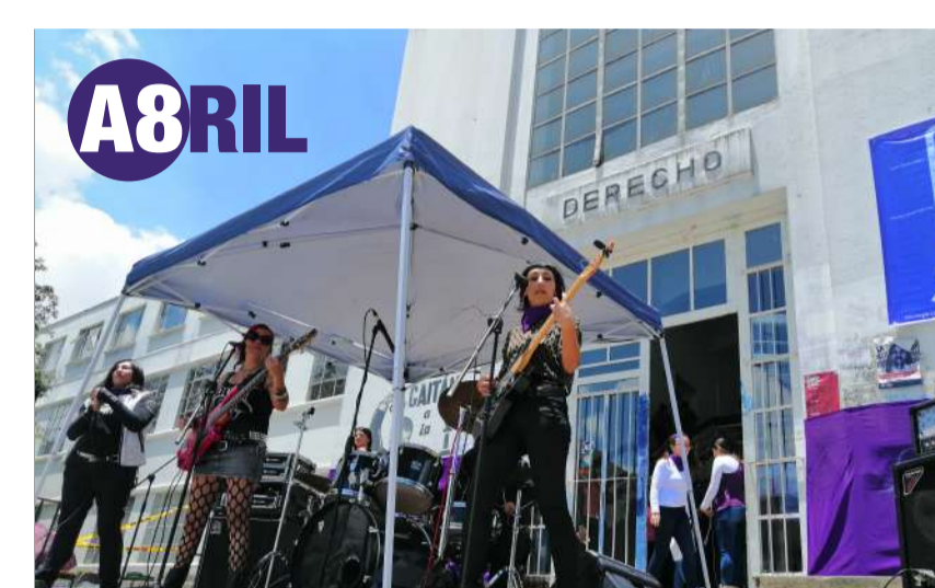
A8Ril es el inicio - Y tú ¿qué harías distinto?

De cara a los desafíos que en materia de género enfrenta la comunidad universitaria, el 8 de abril se realizó el lanzamiento de la estrategia contra las violencias sexuales y la desigualdad de género, la cual estuvo a cargo de un comité triestamentario en el cual participaron docentes, administrativos y estudiantes a través de colectivos feministas.