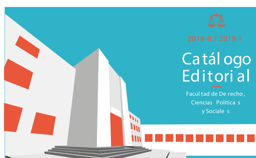
Catálogo Editorial 2018-II / 2019-I

UNIJUS invita a consultar el Catálogo Editorial 2018-II-2019-I Facultad de Derecho Ciencias Políticas y Sociales.