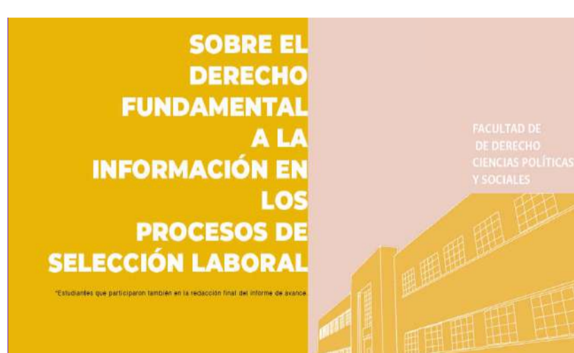
1º Informe de Avance Observatorio Sobre el Derecho Fundamental a la Información en los Procesos de Selección Laboral.

Invitamos a consultar el Primer Informe de Avance del Observatorio Sobre el Derecho Fundamental a la Información en los Procesos de Selección Laboral.