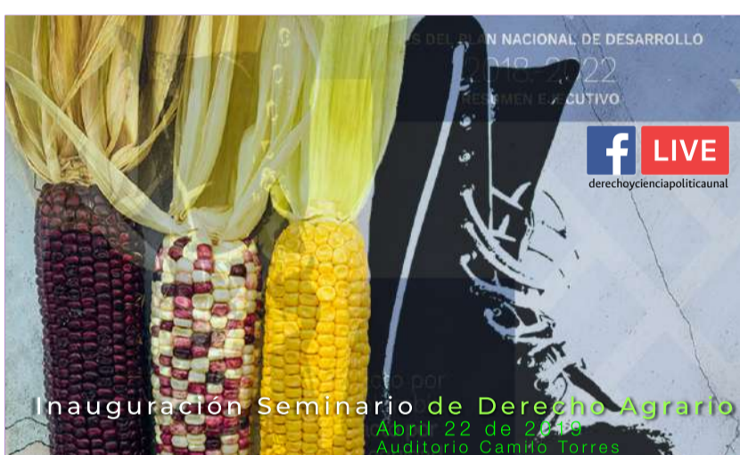
Inauguración Seminario de Derecho Agrario.

El 22 de abril de 2019 se llevará a cabo el evento: "Inauguración Seminario de Derecho Agrario" de 6:00 pm a 8:00 pm en el Auditorio Camilo Torres. Transmisión por Facebook Live a través de @derechocienciaspoliticaunal.