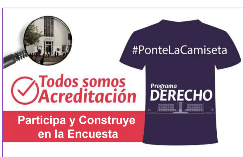
Encuesta de Acreditación Programa de Derecho.

Todos Somos Acreditación. Participa en la encuesta de Acreditación del Programa de Derecho.