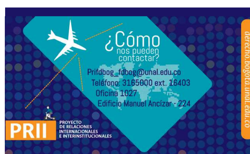
Invitamos a seguir las redes sociales del Proyecto de Relaciones Internacionales e Interinstitucionales.