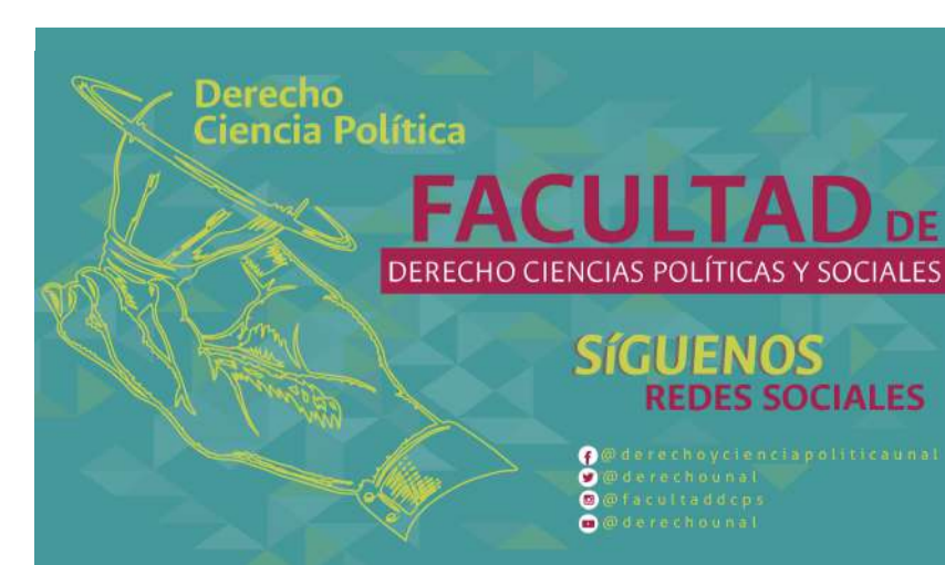
Invitamos a seguir las redes sociales de la Facultad de Derecho, Ciencias Políticas y Sociales.