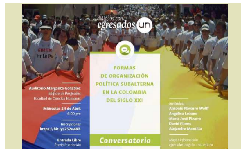
Formas de Organización Política Subalterna en la Colombia del Siglo XXI.

Se invita al Diálogo con Egresados "Formas de Organización Política Subalterna en la Colombia del Siglo XXI". Miércoles 24 de abril de 2019. ENTRADA LIBRE.