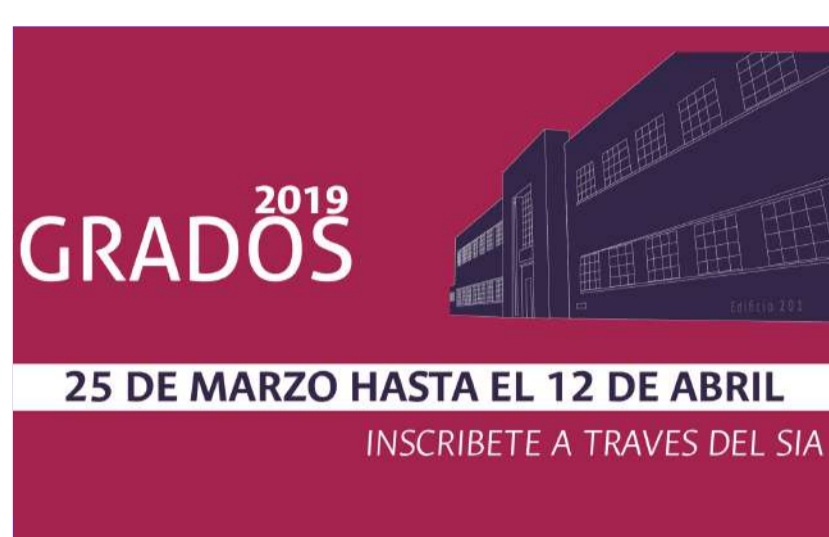
¿Quieres Graduarte y no Sabes Cómo?

Todos Somos Acreditación. Participa en la encuesta de Acreditación del Programa de Derecho.