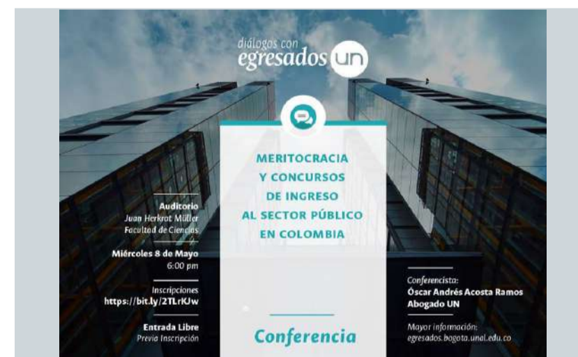
Meritocracia y Concursos de Ingreso al Sector Público en Colombia.

El próximo 8 de mayo de 2019, se llevará a cabo el diálogos con Egresados "Meritocracia y Concursos de Ingreso al Sector Público en Colombia". ENTRADA LIBRE.