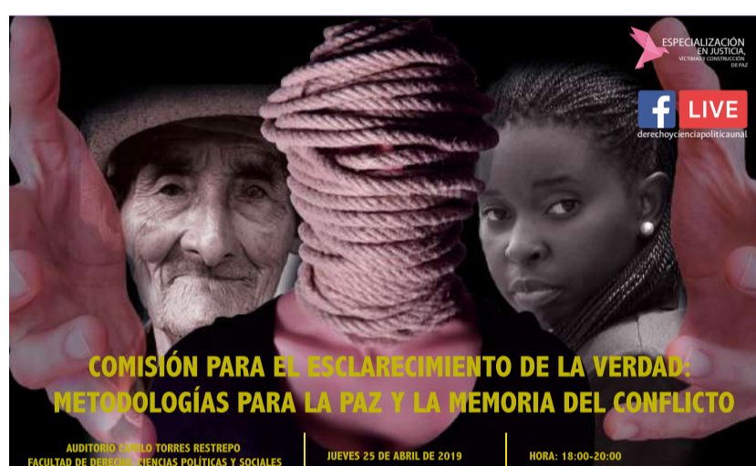
Comisión Para el Esclarecimiento de la Verdad: Metodologías para la Paz y la Memoria del Conflicto.

El próximo jueves 25 de abril de 2019 de 6:00 pm a 8:00 pm, en el Auditorio Camilo Torres se realizará el evento: Comisión Para el Esclarecimiento de la Verdad: Metodologías para la Paz y la Memoria del Conflicto.